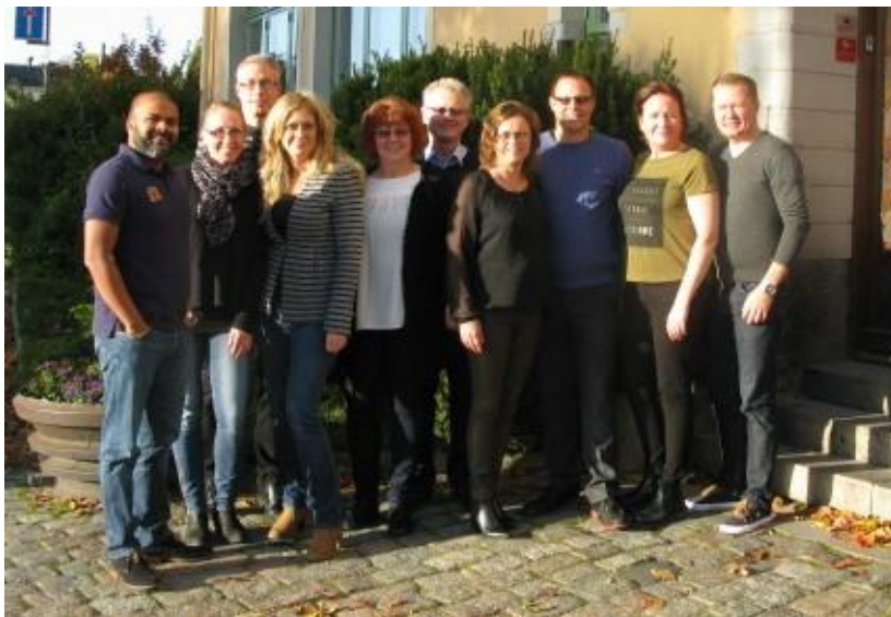
NEAT-teamet med fruar i Eskilstuna.